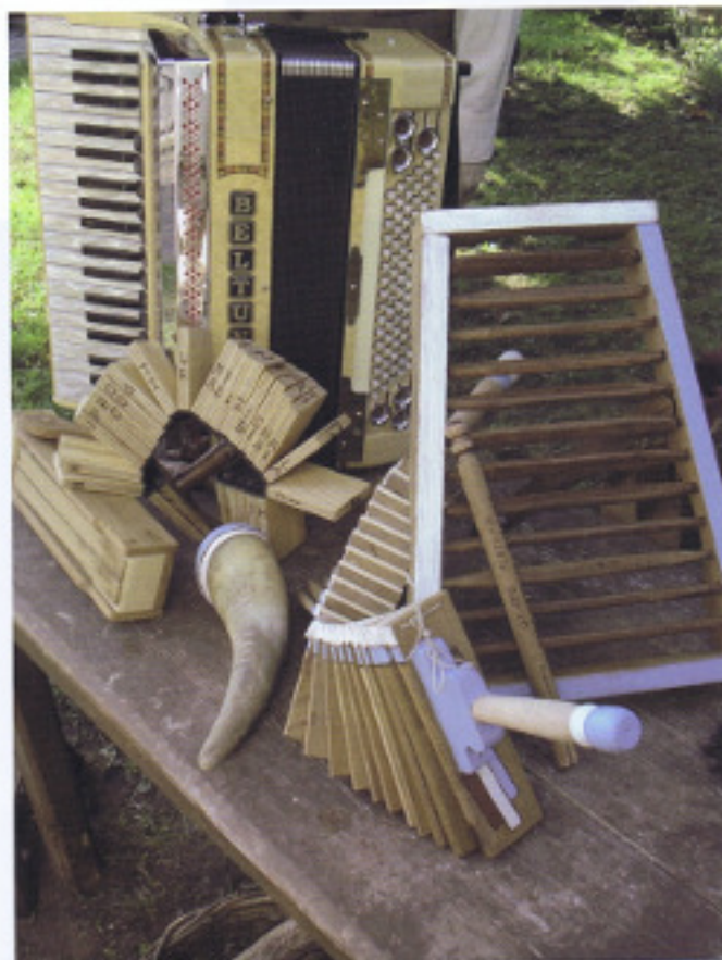
Strumenti rudimentali utilizzati dal coro

Ecco quindi il Bidow-basso, versione popolana del contrabbasso, noto in gergo come bidofono, presente ancora nelle aree di lingua slovena