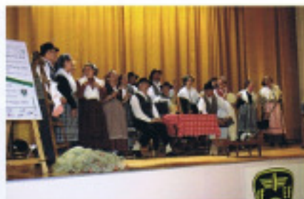
Spettacolo del coro a Divrto (Slo)