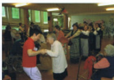
Un momento del progetto Musica e Vita