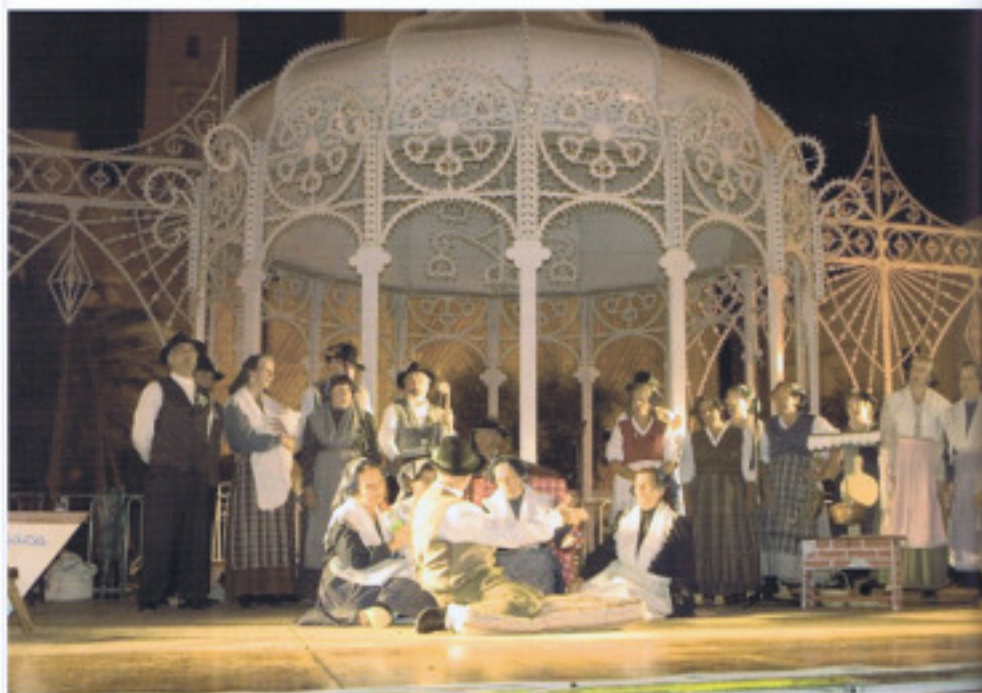
Spettacolo del coro a Galpòli