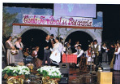
Esordio del coro del Gruppo Costumi Tradizionali Bisiachi al 1° "Cantafestival de la Bisacaria", dicembre 2004