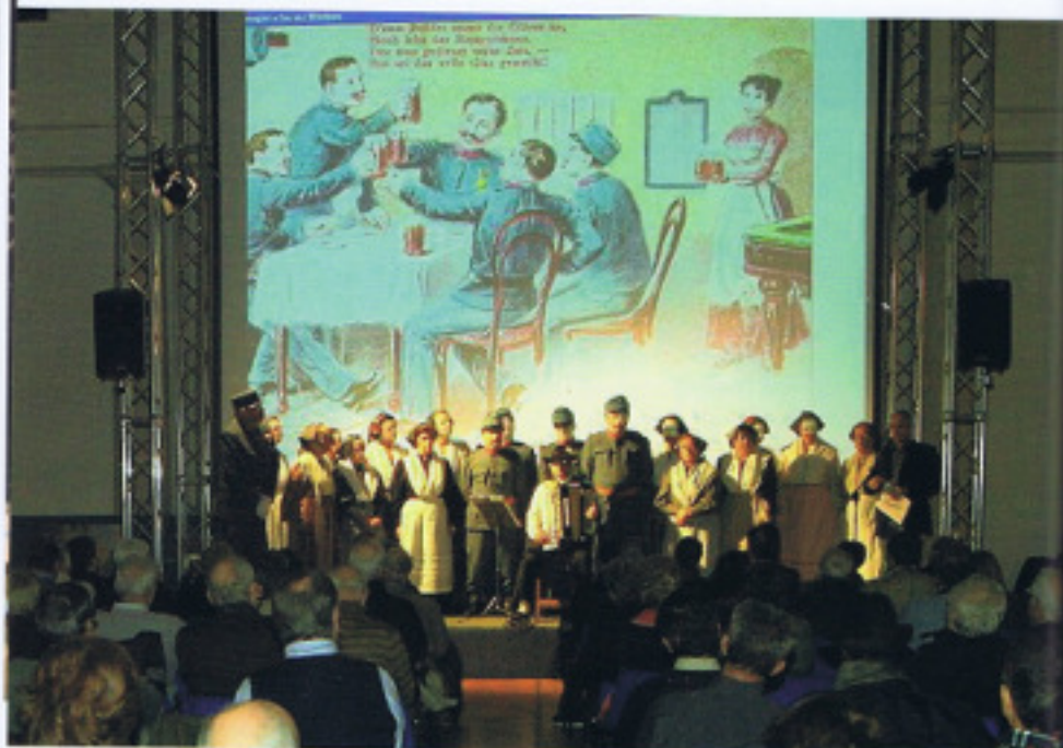
Spettacolo al Congresso Mondiale degli Esperantisti (Trieste, Casa della Cultura Tedesca)

sopravvive ormai solo in alcune zone d'Italia o all'interno di piccole comunità, dove continua ad unire giovani ed anziani, diventando strumento di aggregazione sociale di grande impatto emotivo e ad esercitare il suo irresistibile fascino sui turisti e visitatori stranieri.