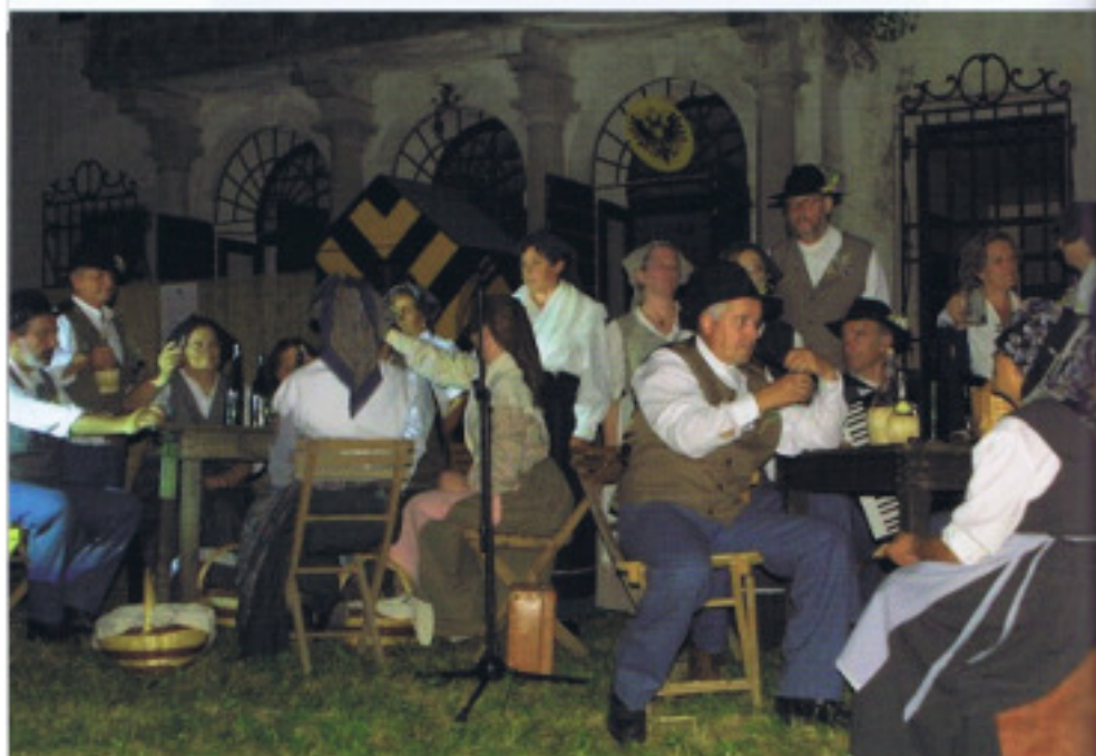
Scena dello spettacolo "Il Quattordiciclotto"

ed in Friuli, il Corno de vaca , autentico corno di mucca, non utilizzato come strumento a fiato, bensì inciso nella parte concava per poter produrre dei suoni mediante sfregamento, il Grat , strumento d'accompagnamento interamente in legno, variante nostrana dei wood-block , la Scressula , o raganella, usata oggi persino dalle orchestre, nonché la Benfatta , idiofono a suono indeterminato composto da una serie di tavolette di legno comune in Bisiacaria fissate da un lato ad una striscia di cuoio e manovrato per mezzo di impugnature alle estremità, curiosamente analogo al Kokiriko giapponese per forma e suono prodotto.